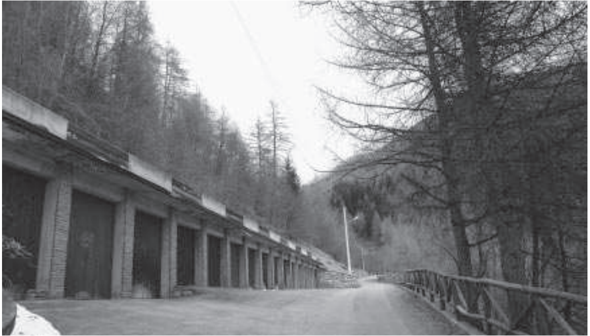
Canè di Vione, garages interrati nel bosco.

Le unità immobiliari siano esse residenziali o agricole sono generalmente sorte in passato in regime di assenza di norme urbanistiche. Allorquando il legislatore le ha poste, imponendo indici di fabbricazione che scoraggiassero l'attività edificatoria fuori dai centri abitati, ha di fatto contemplato solo l'esistente, precludendo ogni altra possibile espansione. La cubatura in eccesso rispetto all'indice di fabbricazione deve quindi essere tollerata solo per gli edifici già esistenti, ma esclusa nel caso di demolizione del fabbricato. È fondamentale stabilire che la demolizione, quale atto significativo della cancellazione di memoria storica, comporti la perdita dei diritti pregressi, e che l'eventuale nuova costruzione sia riportata agli indici di fabbricazione vigenti nell'area. Nessuno può confutare un diritto acquisito ma se il proprietario lo fa a spese dell'esistente, si altera lo status quo - ante , e quindi si deve perdere il vantaggio derivante dalla preesistenza del manufatto alla legislazione edilizia.