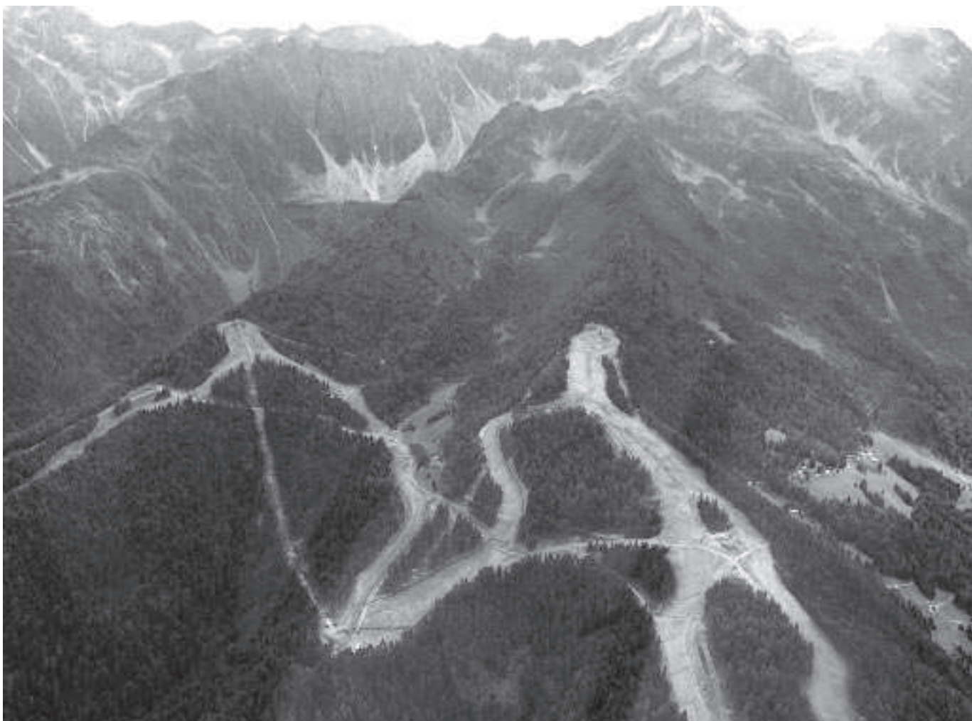
Ponte di Legno, i lavori di ampliamento del demanio sciabile Ponte di Legno-Temù.

Si veda il decoroso edificio ottocentesco di Temù, qui illustrato, che è stato per metà innalzato con lo stile della baita montana e per l'altra metà con la tipologia dei capannoni artigianali. Ambedue gli interventi hanno reinterpretato stravolgendolo l'edificio originario.