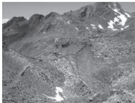
SOPRA, Temù, Forte Bocchette di Val Massa.