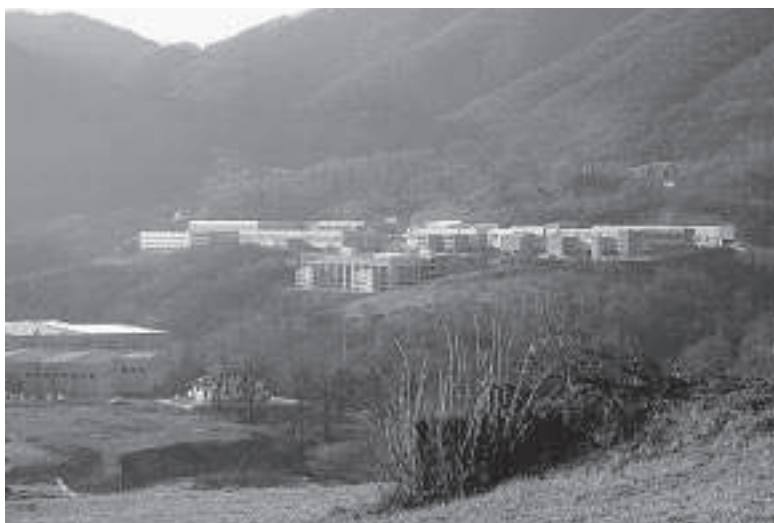
Lumezzane, PIP 2.